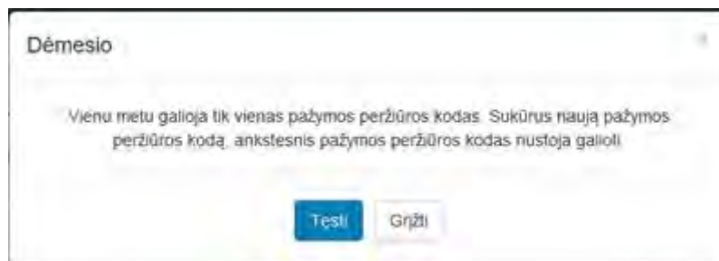
2 paveikslas. Pasirinkti tęsti veiksmą

Sistema sugeneruoja naują pažymos peržiūros e. sveikatos portale kodą, kuris rodomas atnaujintame medicininės pažymos peržiūros lange.