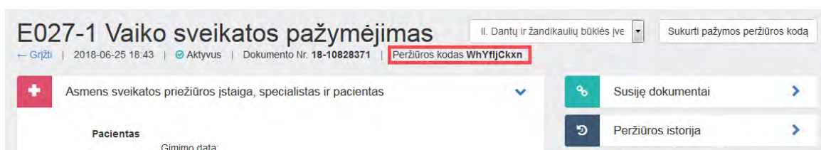
3 paveikslas. Sugeneruotas peržiūros kodas

Sistema sugeneruoja naują pažymos peržiūros e. sveikatos portale kodą, kuris rodomas atnaujintame medicininės pažymos peržiūros lange.