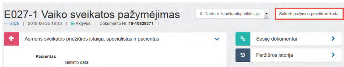
1 paveikslas. Sukurti pažymos peržiūros kodą